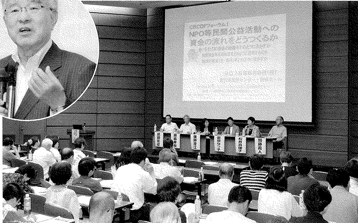
▶ 基調講演者に2人を加えたパネリスト、2人のコメンテーターらによって行われたパネルディスカッション